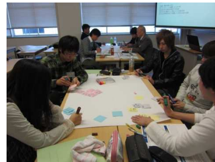
ワークショップ 模様(浜松学院大学)