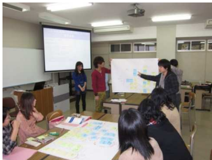
ワークショップ 模様(豊橋創造大学)