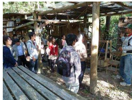
フィールドワーク(ゆずりは学園)