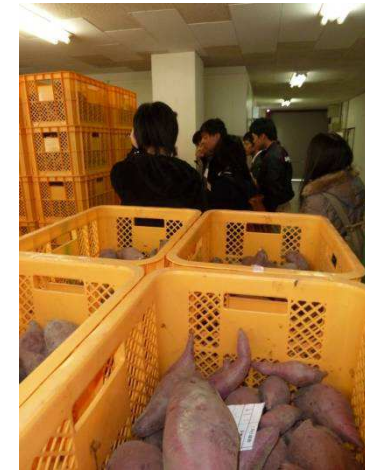
フィールドワーク(コスモグリーン庭好)