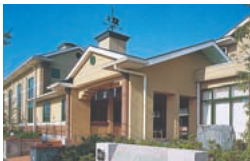
磐田市新造形創造館の外観

磐田市にあるこの体験型文化施設は、ガラスや金属造形の充実した工房を備え、専属アーティストらが独自のアート作品を制作しています。また、ギャラリーでは、年間12回の企画展を開催。子どもから高齢者まで、気軽にアートの世界を楽しんでもらえるよう、造形教室や工房見学、アクセサリー作り等ができる造形体験コーナーを実施しています。ほかに、オリジナルアート作品の販売ショップやレストランなどもあります。