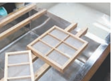
伝統工芸の紙すき体験

伊那谷道中は、江戸から明治にかけての伊那谷の街並みが再現しており、古き時代の「ものづくり」を体験できるミュージアムパークです。エリア内には、伝統工芸館や体験工房など、30以上の施設が集まっており、いろいろな体験や無料の昔遊びもできます。また、伊那谷温泉やレストランなどの食事処も揃っているのので、体験にチャレンジした後は温泉や食事を楽しめます。